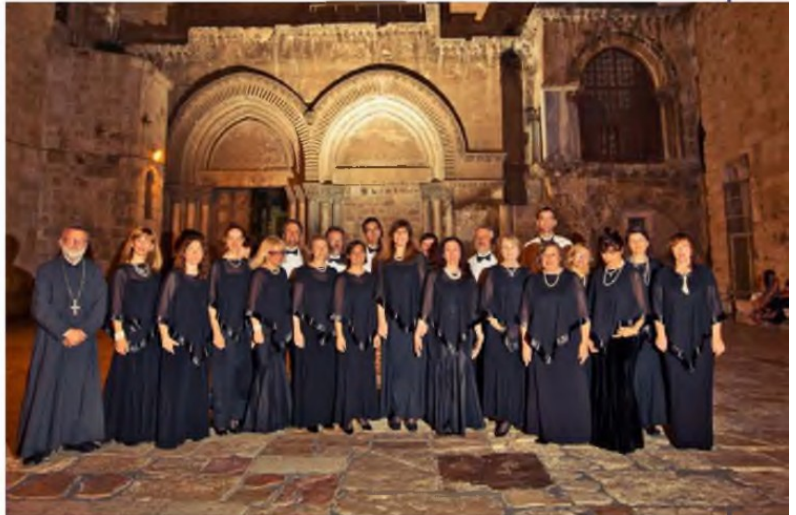
Испред Храма гроба Господњег после концерта Света музика у Светој земљи, Јерусалим - 2012.