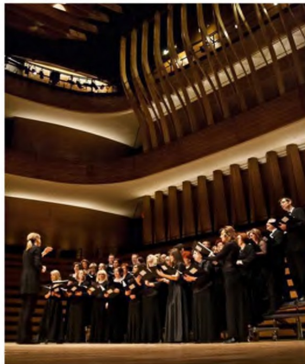
Концерт поводом десетогодишњице постојања и рада, Кернер хол - 2010.

И мада су пробе тренутно обустављене, а концерт за ову годину отказан, Хор не седи скрштених руку, већ унапред планира програм којим ће прославити две деценије постојања. Ако нисте имали прилике