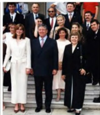
Са принцем Александром Карађорђевићем после потписивања Повеље о оснивању Савеза српских хорова - 2003, Бели двор - Београд